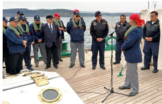
Pirata de la Hermandad de la Costa discursando.

Al pasar frente al dique seco N°2 -los diques no tienen nombre sino hasta que cumplen 100 años- recuerdo una historia de muchas: la del tsunami del 27 de febrero de 2010, que hace quince años asoló el sur de Chile.