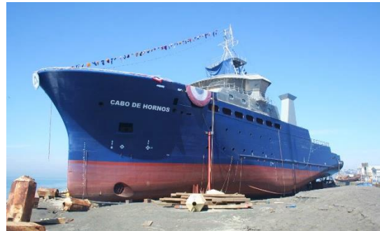
ASMAR y el Cabo de Hornos luego del 27F.