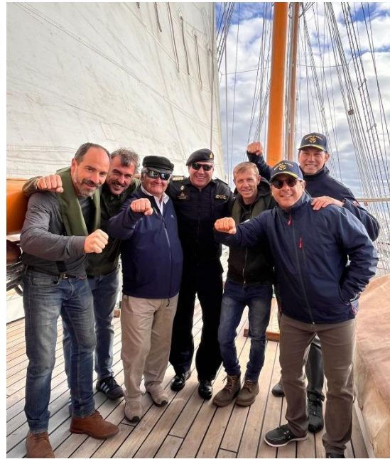
Carretas y pseudo carretas a bordo.